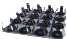
Подставка под колбы